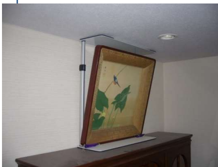
斜め上から見ると