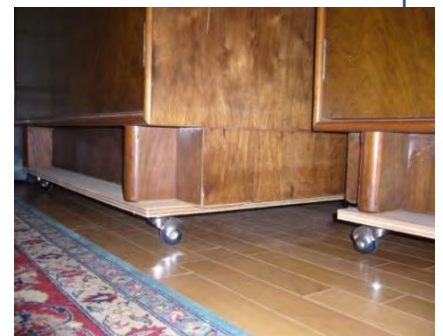
滑り車の上にタンス